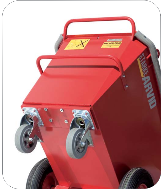
Kahdet vaunupyörät Kahdet kahvat