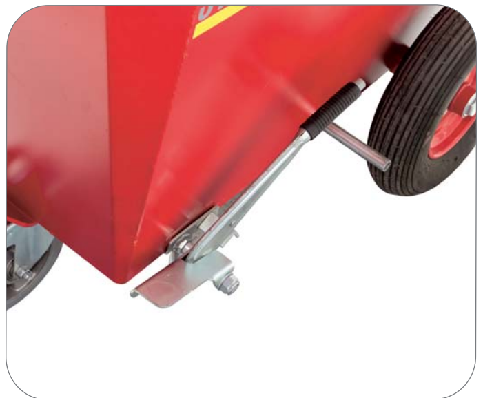
Käsi- ja jalkajarru Polyuretaanipyörät