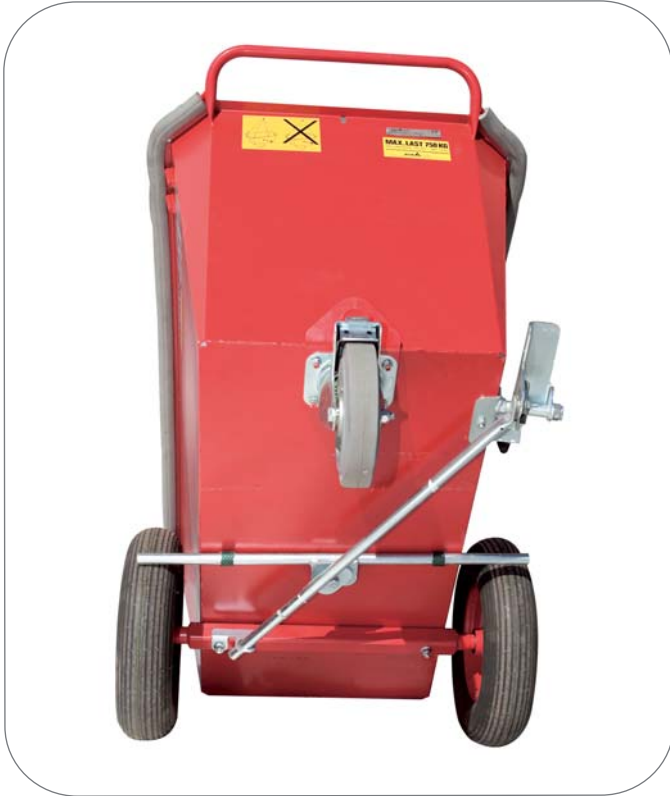
Käsi- ja jalkajarru